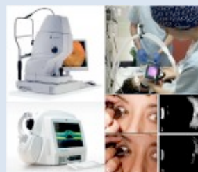
Imagen de fondo de ojo (práctica)