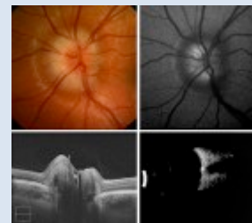
Imagen de fondo de ojo (teoría)